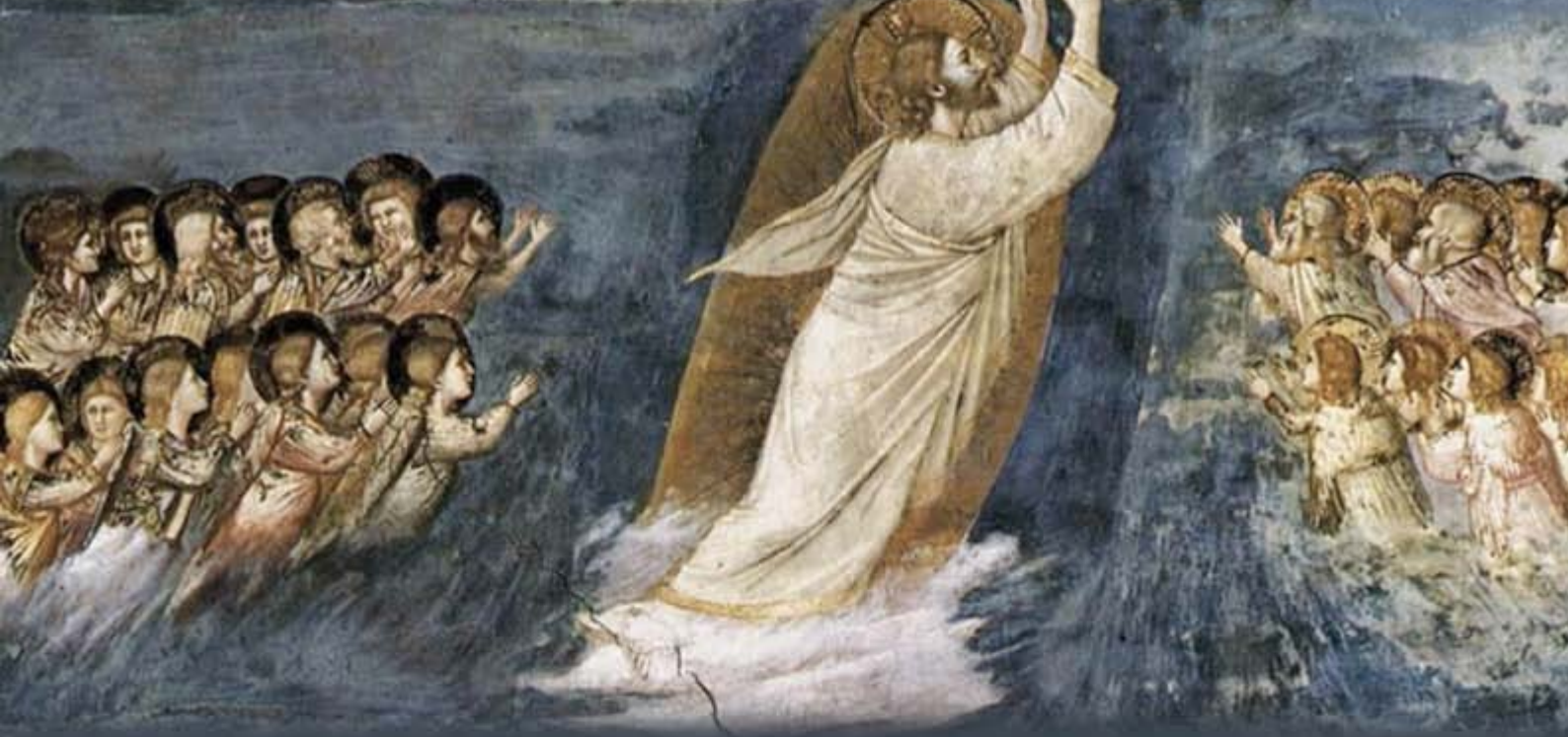
Giotto di Bondone, église Arena de Padoue .