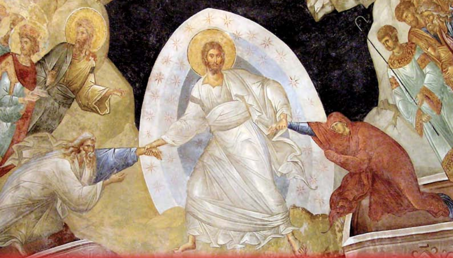
Fresque - Résurrection, Jésus-Christ tirant Adam et Eve de leurs cercueils dans l'enfer, Eglise Chora (Kariye Muzee) à Istanbul, Turquie.