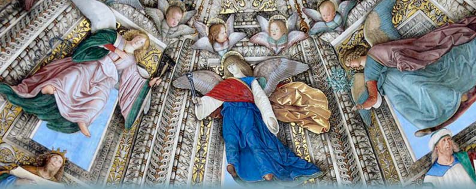
Fresque de la coupole du sanctuaire de Loreto (Marches, Italie), par Melozzo da Forlì.